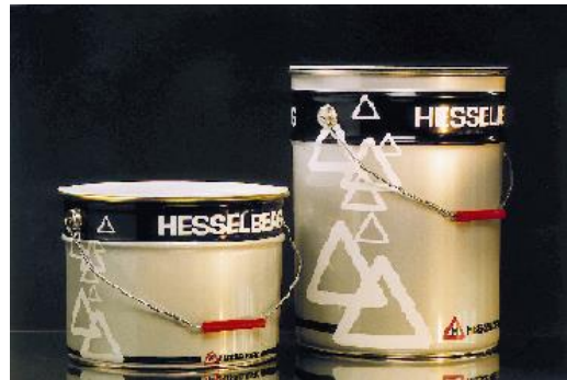
Barrikade EP-SL 600 – når slitestyrke er avgjørende

Eventuell sparkling/reparasjon eller oppretting av undergulvet foretas med StoPox GH 205 tilsatt fyllstoff, tilslag eller tiksotroperingsmiddel.